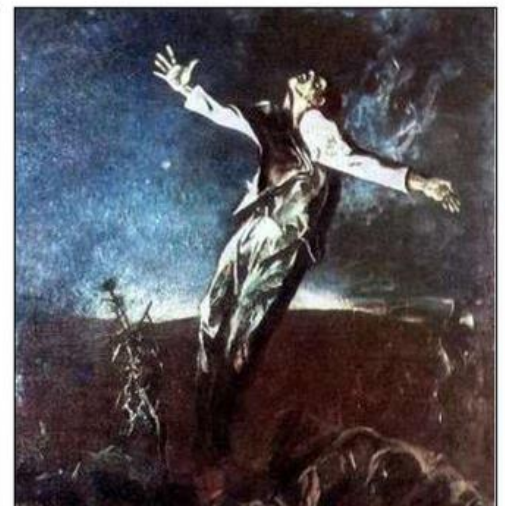
А. Мыльников. Испанский триптих