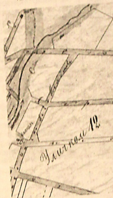
Выгонная улица. Фр.

СОПРЕДЕЛЕНИЕМ местоположения Турецкого переулка дело обстоит сложнее. По одним документам он тянулся вдоль реки Становки между улицами Урицкого и Нижней Лобывревской. В 1921 г. его переименовали в переулоч Становка, ныне же это 2-й переулоч Р. Люксембург. По другим документам Турецким переулком до 1921 г. называлась часть нынешней Коммунистической улицы, пролегавшая от реки Становки до современной улицы К. Маркса (другая часть Коммунистической улицы – от Клоповского колодца и до Становки – именовалась 1-й Низинской улицей). Впрочем, можно предположить, что в Рославле существовало два Турецких переулка. Часть рославльских